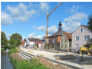
Neugestaltung der Ortsmitte