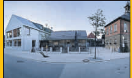
BROTZEIT IN DER SPEZEREI