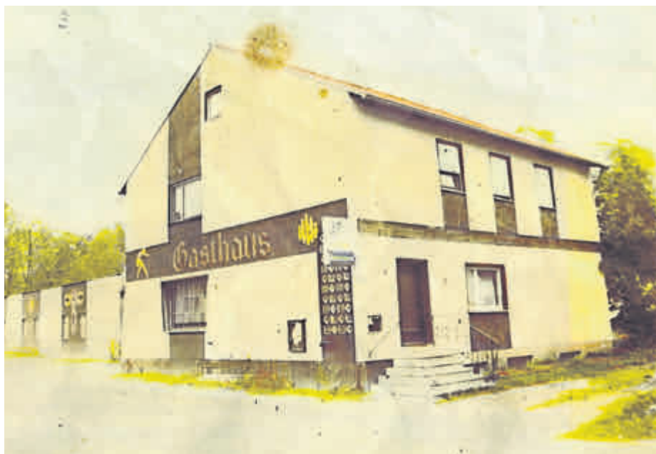
Ehemalige Kegelbahn mit Gasthaus in der Hauptstr. 19

Nach der Aufnahme in den Verein Bamberger Sportkegler und in den bayerischen Landesportverband starteten 20 Spieler in zwei Mannschaften in die Saison 1972/73. Höhepunkt der frühen Vereinsgeschichte war 1980/81 der Aufstieg der 1. Mannschaft in die A-Klasse und die Meldung von vier Mannschaften. In den folgenden Jahren konnte der Verein seine Leistungen noch weiter steigern und in höhere Klassen aufsteigen. Später führte aber der Weggang einiger sehr guter Kegler wieder zum Abstieg.