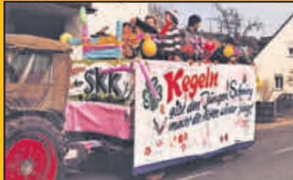
50 JAHRE KEGELVEREIN