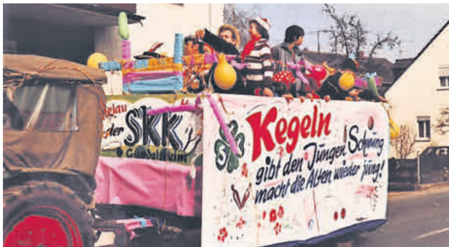
Wagen des SKK Gundelsheim beim Gundelsheimer Faschingszug in den 1980er Jahren