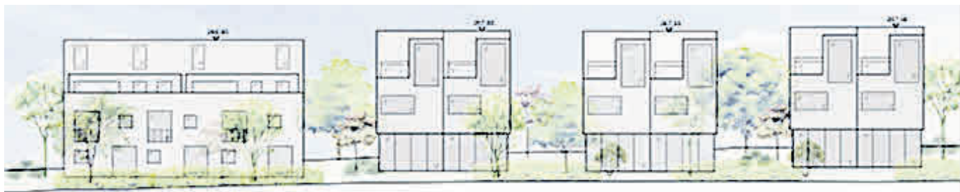
Blick vom Föhrenweg Richtung Norden auf das mögliche und geplante Areal