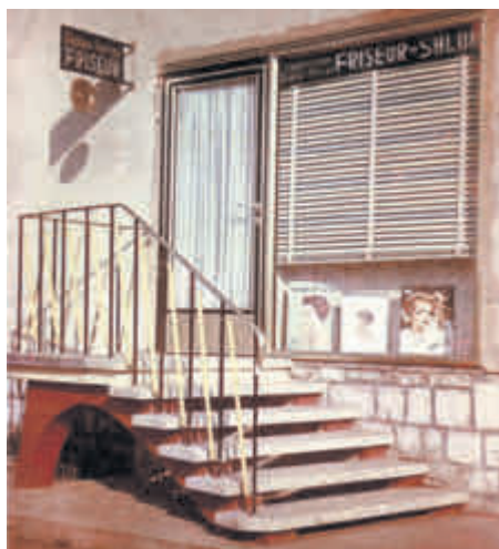
Der Eingang des Friseursalons Oeckler, Hallstadter Str. 10, im Jahr 1959.