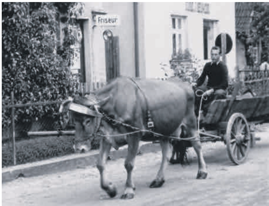
Links im Bild der Friseurbetrieb des Josef Söllner um 1954.