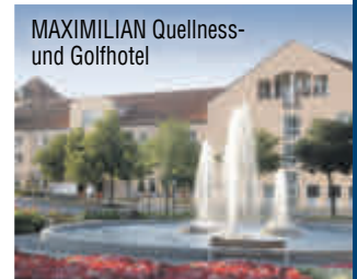
MAXIMILIAN Quellness- und Golfhotel