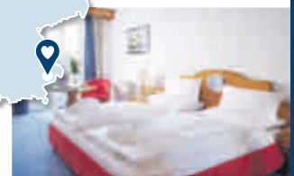
Bsp. DZ MAXIMILIAN Quellness- u. Golfhotel