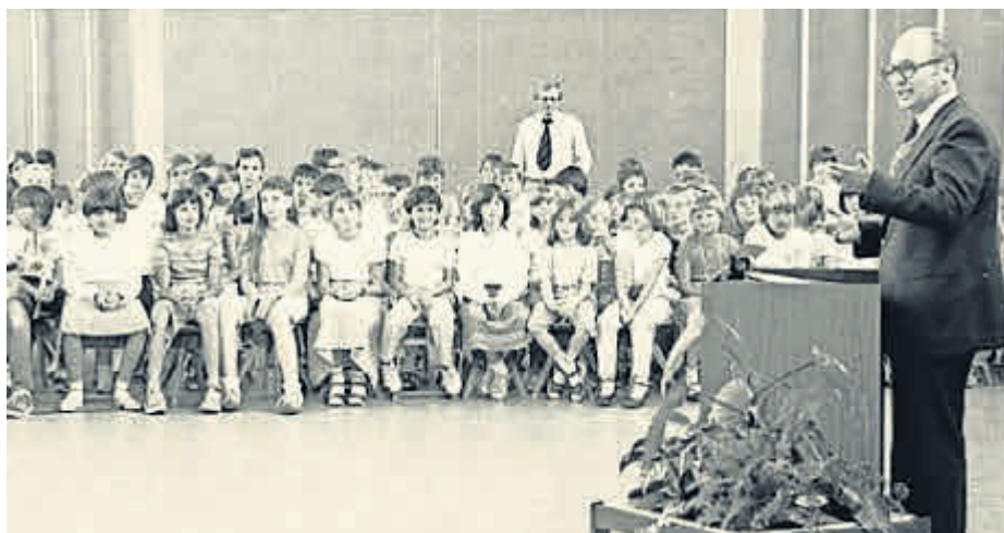
Bürgermeister Michael Arneht hielt die Festrede zur Einweihung der Schulhauserweiterung.