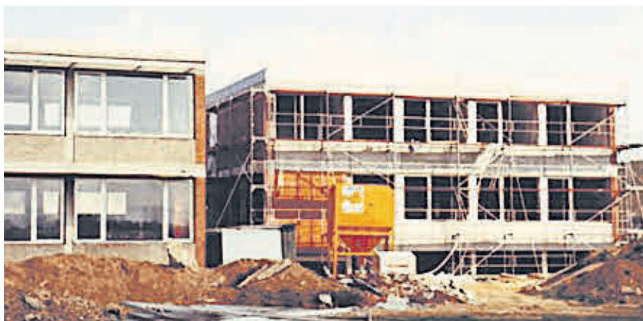
Rechts der Rohbau des Erweiterungsbaus im Herbst 1981.

Aus der 1963 vierklassigen Schule entwickelte sich eine neunklassige Grund- und Teilhauptschule für die Klassen 1 – 6, die Klassen 7 - 9 besuchten die Schule in Memmelsdorf. Alle Funktionsräume wurden zu Klassenzimmern umgewandelt. Als im Schuljahr 1979/80 zehn Klassen, aber nur acht Räume vorhanden waren, beschloss der Gemeinderat einen Anbau an das bestehende Schulhaus. 1980 erhielt das Bamberger Architekturbüro Neundorfer den Planungsauftrag. Im Spätsommer 1981 war Baubeginn. Bereits am 27.11. 1981 fand das Richtfest statt. Nach sehr kurzer Bauzeit wurde der Erweiterungs-