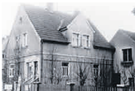
Spezerei- und Flaschenbierhandlung Eichelsdörfer, Hauptstr. 7 um 1956, Bildgeber: Georg Wittmann, Gundelsheim