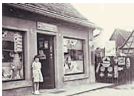
Lebensmittelgeschäft Johann Schoppel, Hallstadter Str. 20