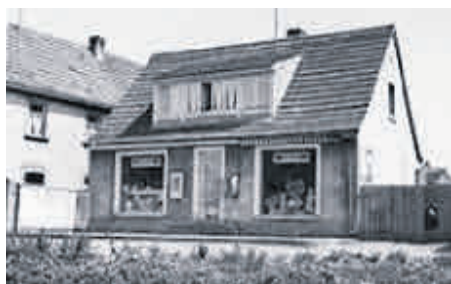
Lebensmittelgeschäft Rudi Schoppel Bamberger Str. 7 im Jahr 1954