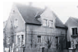
Lebensmittelgeschäft Johann Schoppel Hallstadter Str. 20, Foto: Lissy Wolf (†)