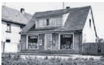
Lebensmittelgeschäft Rudi Schoppel Bamberger Str. 7

Im dritten Teil der historischen Reihe „Gundelsheim vor 65 Jahren“ hat die Redaktion in der vergangenen Ausgabe die vier historischen Lebensmittelgeschäfte beschrieben. Dabei kam es zu einer falschen Zuordnung von Text und Bild. Hier die Richtigstellung!