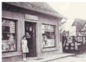
Lebensmittelgeschäft Paul Kossmann Hallstadter Str. 1, um 1958, Foto: Regina Nowak