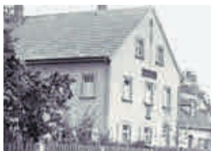
Spezerei- und Flaschen- bierhandlung Eichelsdörfer Hauptstr. 7 um 1956, Foto: Georg Wittmann