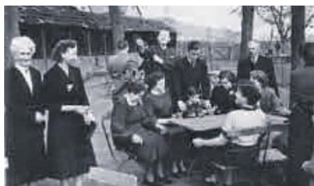
Ein Blick in den Biergarten Leicht mit Kegelbahn (links) in den 1950er Jahren, Bildgeber: Waldemar Moritz