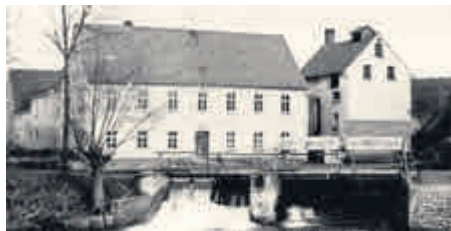
Das Gasthaus Leicht in den 1950er Jahren, rechts das Brauhaus Bildgeberin: Margarete Schiml (†)