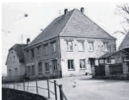
Das Gasthaus Casino kurz nach dem Umbau im Jahr 1958, Bildgeber: Anton Hauptmann (†)