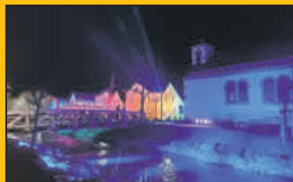
NEUES JAHR RUNDGANG