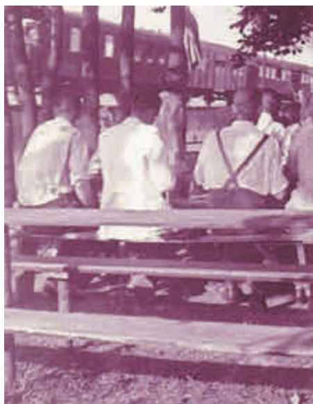
Der sog. Gundelsheimer Keller direkt am Gundelsheimer Bahnhof, Bildgeberin: Lydia Kolter (†)