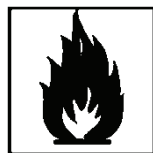
F+ - hochentzündlich F - leichtentzündlich