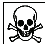
T+ - sehr giftig T - giftig und/oder krebserzeugend